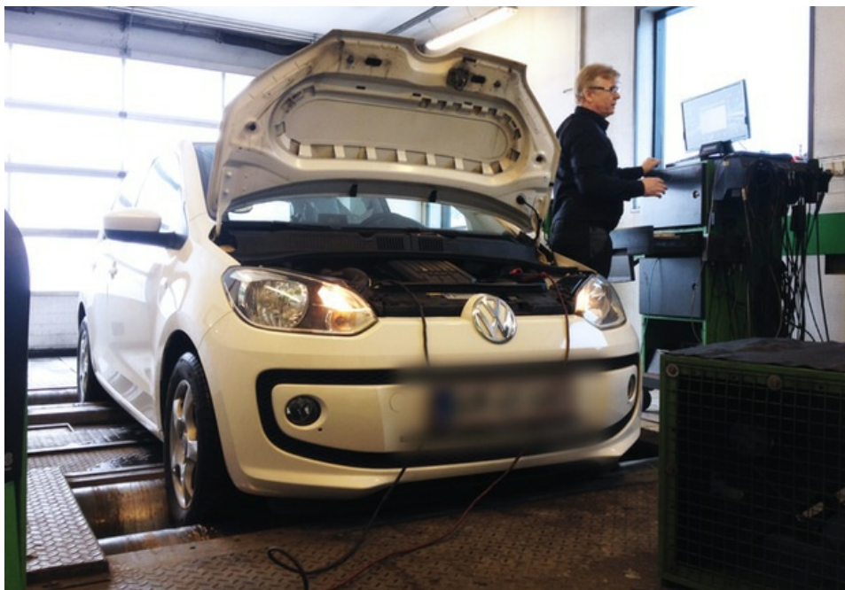
Skrevet 6. feb 2015 af Anders Richter.